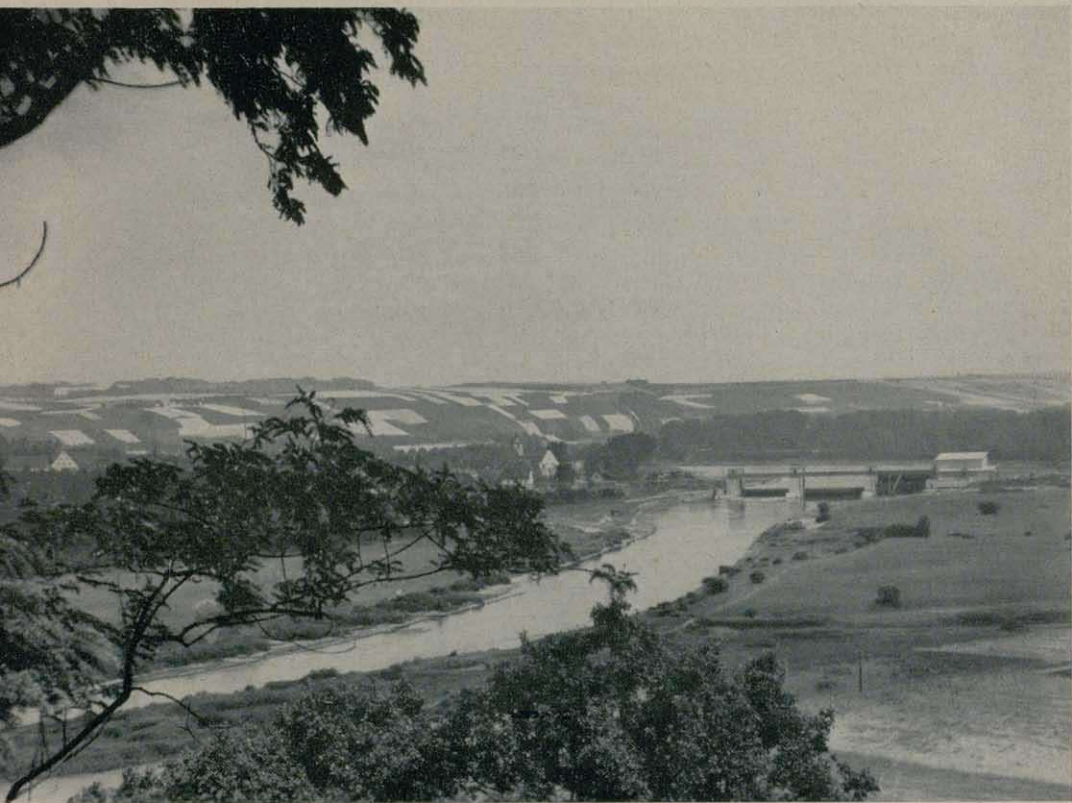
Die Staustufe Volkach wurde zum organischen Bestandteil der Landschaft

Berg von rd. 25 m Höhe aufgeschüttet werden. Wegen der großen Landarmut, den geringen Waldbeständen in dieser Gegend und der Transporthöhe des Baggergutes, wies diese Kippe im „Spessartwald“ viele Nachteile auf. Weitere Überlegungen führten zu dem Schluß, daß es möglich sein mußte, den gesamten Aushub des Durchstiches am Halburghang unterzubringen. Die Ausformung dieser großen Kippe, ihre Einpassung in das Landschaftsbild, wozu das Stehenlassen eines schmalen Streifens des ehemaligen Hangwaldes wesentlich beitrug, fanden die Zustimmung des Naturschutzbeauftragten der Regierung. So wurde die längere Transportweite des Aushubgutes bewußt in Kauf genommen und die gesamten Massen vor der Halburg abgelagert. Die Kippe wird so bepflanzt, daß sie sich unauffällig in die Landschaft eingliedert.