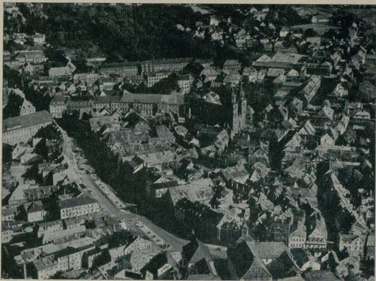
Bayreuth, die Altstadt (Luftaufnahme)

stadt trägt dieses Charakteristikum in ihrem Ortsnamen, hier allerdings mit dem Stammesnamen der Bayern verbunden. Schwer auszumachen ist es, ob dieses Bestimmungswort ursprünglich stamm-baierische Rodung ausdrücken soll, oder ob es sich nur um einen Hinweis auf die Herrschaft der Grafen von Dießen-Andechs, die späteren Herzöge von Meranien handelt, die aus Altbaiern nach Franken kamen und unzweifelhaft die Gründer der Stadt Bayreuth waren, jener 1194 erstmals in einer Prüfeninger Urkunde erwähnten Siedlung, die dann 1231 bereits civitas genannt wurde.