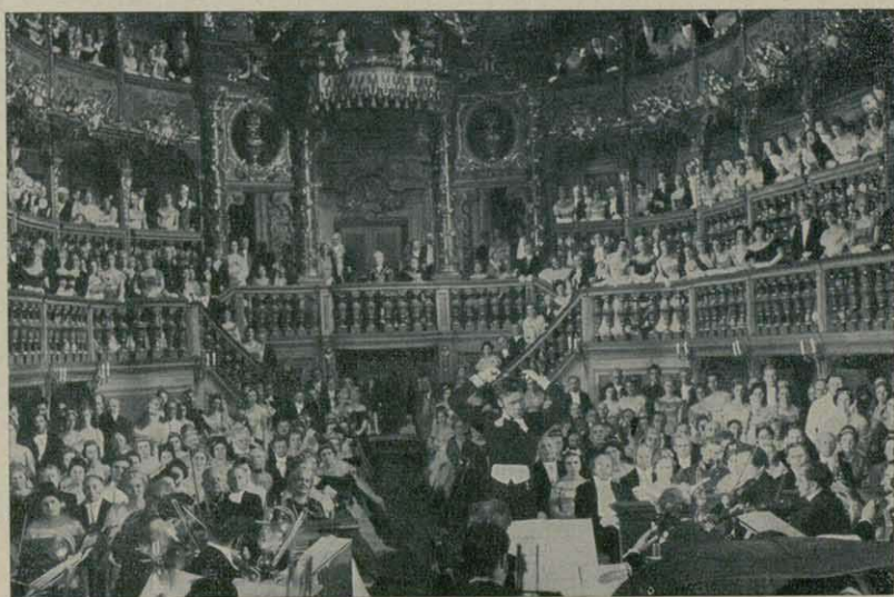
Das Markgräfliche Opernhaus in Bayreuth (als Schauplatz in dem Liszt-Film der Columbia, Hollywood)

Wollten wir alle sakralen Bauten erwähnen, müßten wir auch in die ehemalige Vorstadt St. Georgen gehen, wo außer der Ordenskirche, die zweifellos seit ihrer Renovierung zu den schönsten Barockkirchen Oberfrankens gehört, die an der Hauptstraße aufgereihten Bürgerhäuser als interessante Baulösungen eines frühen „Koloniestils“ gelten dürfen.