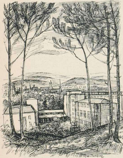
Das neue Heil- und Moorbad vom Waldrand aus

von und zu Guttenberg, welche Familie dem Bad zum heutigen Ruf verhalf.