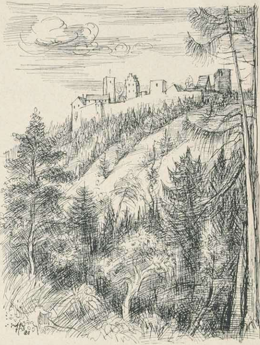
Salzburg von Süden

Das Bad war von jeher in adeligem Besitz: 1451 Thüngen, 1685 Grappendorf, 1753 Borié, 1793 Messina, 1837 Haxthausen, 1868 Brenken, 1884 Rotenhan und seit 1888 ununterbrochen