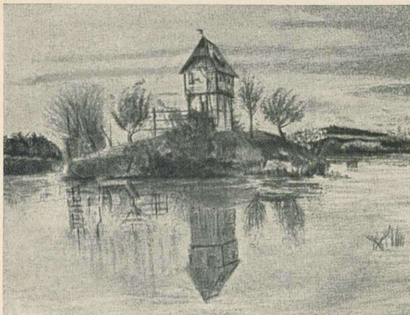
Abb. 2. Albrecht Dürer: Weltherhaus. Aquarell um 1500 (Ausschnitt).

tung und sorgfältige Erforschung wichtig ist. Neben den sich aus ihnen entwickelnden Burgen wurden sie noch lange verwandt, so daß sie sogar von Albrecht Dürer dargestellt werden konnten (Abb. 2). Das ist sehr erfreulich, denn dadurch lernen wir das Aussehen dieser Wehrtürme kennen.