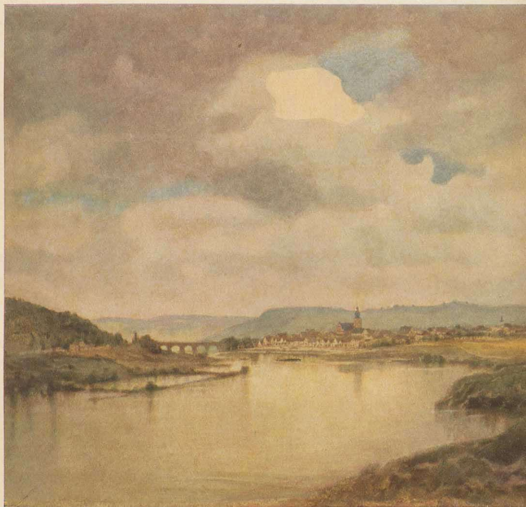
Marktheidenfeld am Main