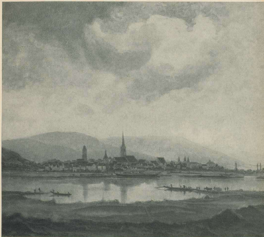
Lohr am Main

Bildrahmen herausfallend. Alles hält sich in einer wohligen, warmen Temperatur: ein weiches Grün, ein zartes Grau, in unendlich vielen Varianten und ein dunkler Ocker- und Umbraton, der ihm die so viel gerühmte „Altmeisterlichkeit“ gibt, die aber nicht nachgemacht ist, sondern seinen eigenen, inneren Vorstellungen entspricht.