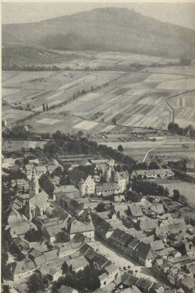
Römhild mit dem Hennebergischen Schloß und der Stiftskirche. Im Hintergrund die Steinsburg

Kade, 1880 in Römhild als der Sohn des Stadtapothekers geboren, trat nach seiner Gymnasialzeit in Hildburghausen bei seinem Vater in die Lehre bis zum Vorexamen, war dann Gehilfe in Römhild und Königswusterhausen und legte in Göttingen nach dem Pharmaziestudium 1904 sein Staatsexamen ab. Nach einjährigem Militärdienst in Coburg mußte er nach dem frühen Tod seines Vaters die ererbte Apotheke verwalten, bis er sie 1914 endgültig erwarb und sie 1955 abgeben mußte. Seinen Apothekerkunden war er ein freundlicher, humorvoller Berater, der manchem den Trost zusprach, den er zur Heilung so