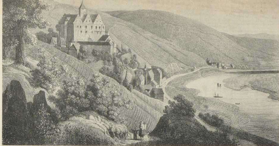
Schloß Mainberg. Stich von Fritz Bamberger (aus: Ludwig Braunsfels »Die Mainufer« Würzburg, 1847)

damals noch ausgedehnten Schweinfurter Weinbaugebiet, läßt er sich doch auch bis ins Alter frische Trauben senden und singt von ihnen in seinem Gedicht: „Abschied von Neuses“, wo er den die Laubbäume entblätternden Herbstwind anspricht: