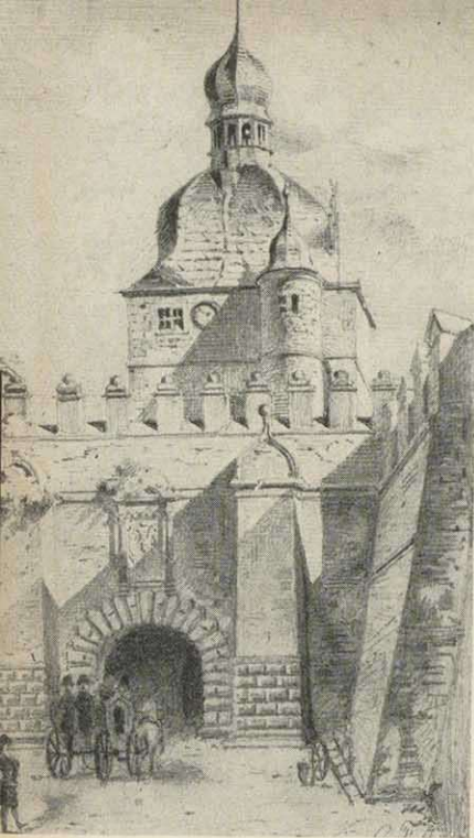
Das Mühlort zu Schweinfurt nach einer Zeichnung v. Prof. Carl Fischer (aus: »Die Mainleite« - Berichte aus Leben und Kultur. 11-1962, H. 1)

Strom des Mäins, an welchem meine Wiege stand im Rebenkranz, Zwar nicht mehr im Sonnenscheine Strahlt er, doch im Abendglanz. (Sie kamen abends an). Und die Sonne selbst noch winket Dir im Scheiden einen Gruß, Mainberg, dessen Zinne blinket Golden über'm Silberfluß. Wenn nicht diese Berge wären, Wäre nicht der Fluß so schön; Und nur weil sie sich verklären In dem Fluß, sind schön die Höb'n. Weil sich mit dem Main der Weinberg, Mit dem Weinberg schmückt der Main, Darum heißt die Stelle Mainberg, Schönster Berg- und Stromverein. Ob erhoben seinen Steinwein Würzburg über'n Rheinwein hat, Mir gewürzter wächst der Mainwein Zwischen Mainberg und der Stadt, Deren Mühlen, deren Brücken Lieblich dort am Strome dämmern.