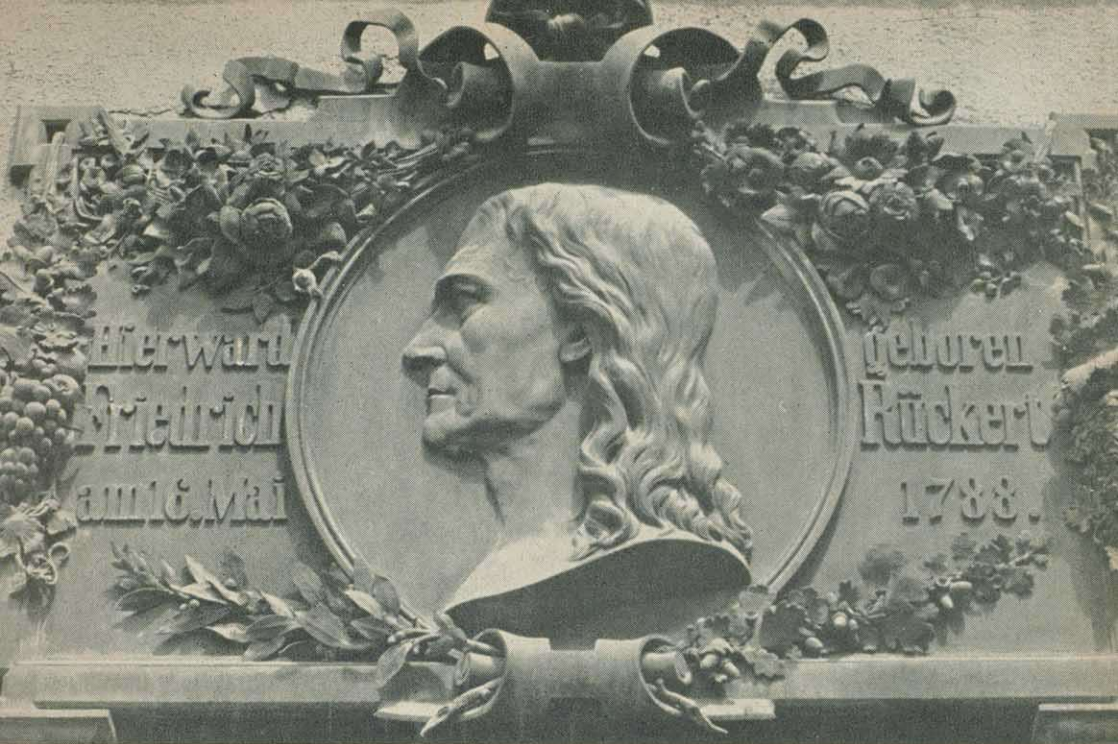
Gedenktafel am Geburtshaus des Dichters Friedrich Rückert in Schweinfurt. (aus: Neujahrsblätter herausgegeben von der Gesellschaft für fränkische Geschichte. XXVI. 700 Jahre Stadt Schweinfurt 1254-1954. Beiträge zu Kultur und Geschichte einer fränkischen Reichsstadt. Schweinf.-Würzburg. 1954)