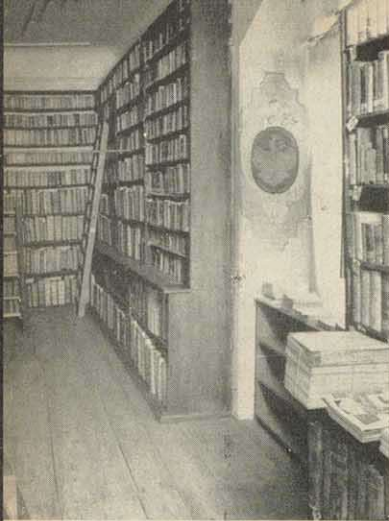
2. Geschoß im Magazin des Stadtarchivs im Friedr. Rückert-Bau