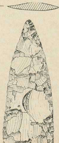
Hornsteinlanzenspitze von Neuses a. Berg Ldkr. Kitzingen 1/2