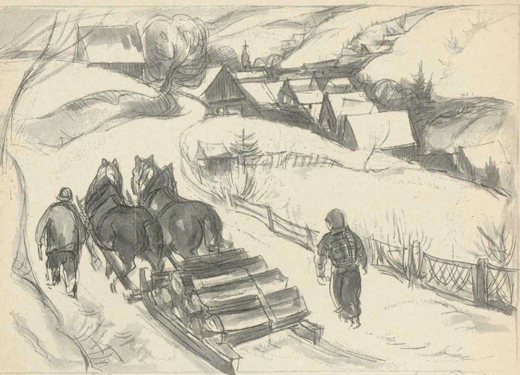
Winter in der Rhön