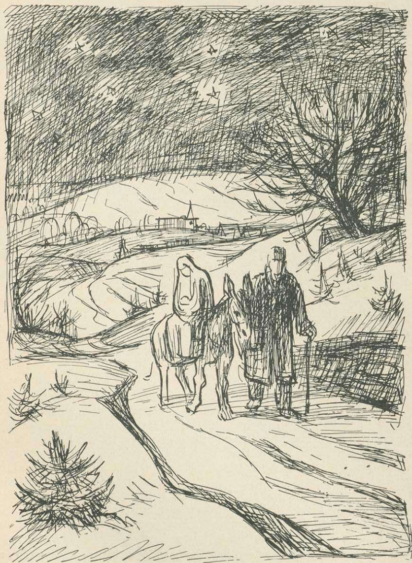
Theo Dreber: „Auf der Flucht“