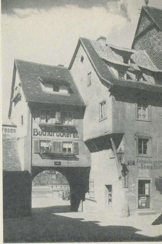
Aus dem „alten“ Würzburg – das Holztor

Der Heimweg nach Würzburg ist mir nicht mehr in Erinnerung. Ich könnte nicht beschwören, ob wir ihn zu Fuß oder mit der Bahn zurücklegten. Der derzeitige Pfarrer von Retzbach, der nun schon seit 30 Jahren dort amtiert und früher als Kaplan daselbst tätig war, versicherte mir aber, die Wallfahrt sei am Nachmittag stets per pedes mainaufwärts gepilgert und die Nachzügler hätten dabei zur geringen Erbauung der Bauern jedesmal die Obstbäume am Straßenrand geplündert. Daran erinnere ich mich nicht. Entweder war ich nicht bei den Nachzüglern, oder wir, die Tante und ich, sind doch mit der Bahn gefahren.