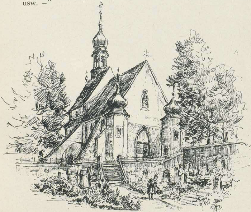
Retzbach, Wallfahrtskirche „Maria im grünen Tal“.

„Der Churfürst und Fürstbischof Johann Philipp von Schönborn war einer der ersten Verehrer der Muttergottes zu Retzbach, denn so fand ich, daß er am 14. September 1646 mit der Marianischen Bürgersodalität von Würzburg hierher wallfahrtete, 1648 am 9. Dezember mit mehreren Aebten und Dechanten da zusammen kam, im Jahre 1649 am 19. August das feierliche Hochamt in der Kapelle hielt und 1651, 1657 am 29. Juni, 1659 am 25. August, 1660 am 9. April, 1663 am 26. April und 1666 jedesmal dahin wallfahrtete usw. —“