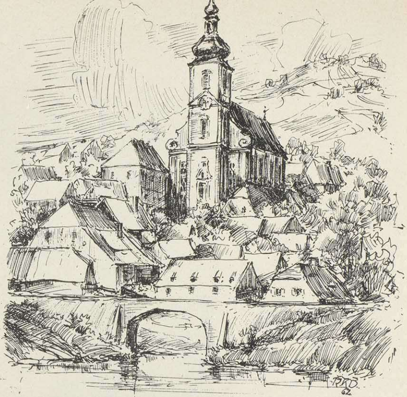
Retzbach mit seiner Pfarrkirche

che Jahre sind gestochen sauber geschrieben, andere wieder fast unleserlich. Im 19. Jahrhundert schweigen sie sich aus über die Wallfahrt; erst 1878 und 79 lese ich unter dem ersten Sonntag im August die lakonische Bemerkung: „Am nächsten Sonntag ist wegen Ankunft der Würzburger Prozession statt der Frühmesse das Amt für die Pfarrgemeinde.“ Sonst nichts weiter. Der erfahrene Pfarrer meint, die Prozession sei eben schon seit Menschengedenken gekommen, das sei immer so gewesen, und man habe es halt für selbstverständlich gehalten, daß es stets so bleiben werde. Was hätte man da also noch viel darüber schreiben sollen, sagte er mit einem klugen Lächeln?