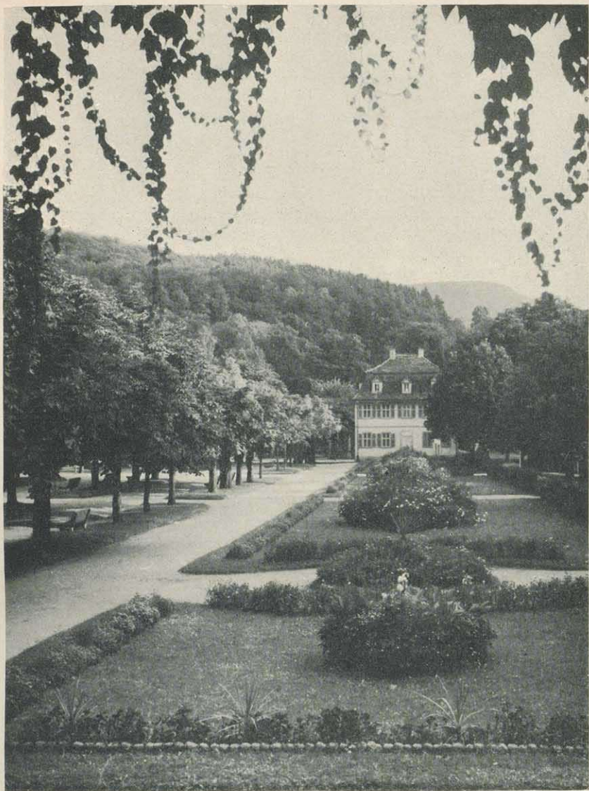
Bad Brückenau, Kurpromenade