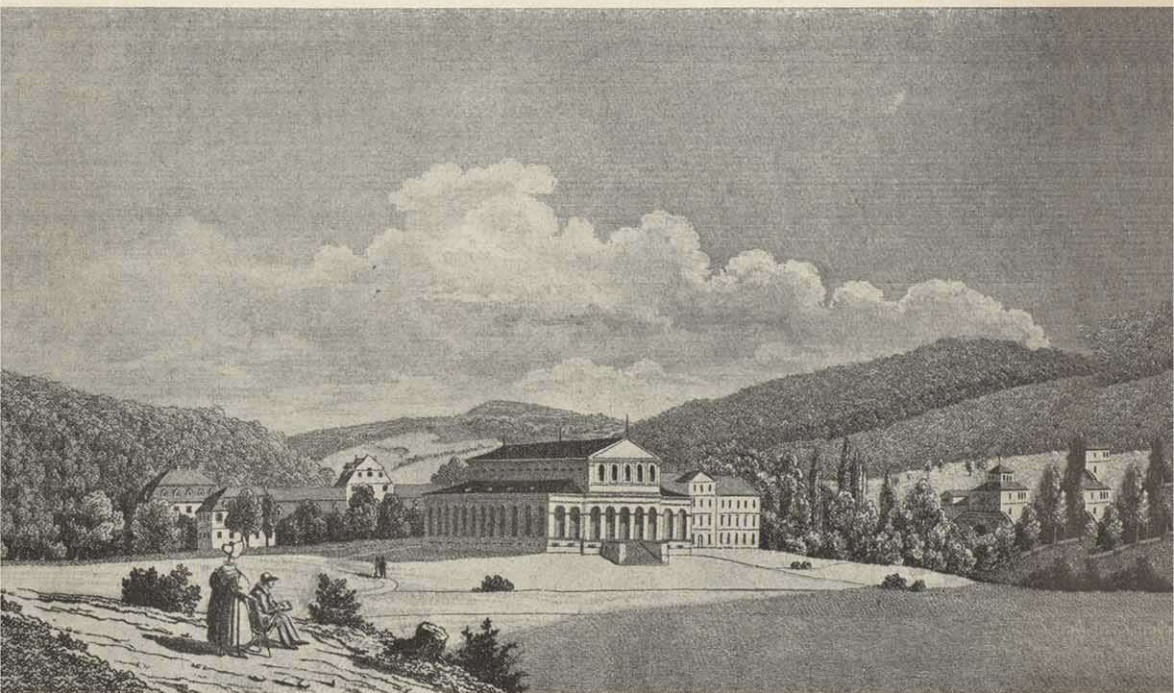
Der Kursaal in Bad Brückenau, aus: Kaspar Gartenhof, „Bad Brückenau in der Ludwigszeit“ (Mainfränkisches Heft 34) von den „Freunden Mainfränkischer Kunst und Geschichte“ zur Verfügung gestellt.

19. Juli 1825. „Wir verweilen zuerst, einige hundert Schritte abwärts von der Höhe des Dreistelz, auf dem weiten, von hohem Buchengesträuch überschatteten Rasenplatze, der vorzüglich schön in der magischen Beleuchtung des Abends erscheint, wenn sie die sanft rauschenden, lichtgrünen Blätter vergoldet. Er ist der Schauplatz der Erholung und der geselligen Unterhaltung. Hier läßt man sich nieder, läßt sich auf dem Sammet des schwellenden Grünes das Auge ruhen von Lust und Wonne, die es eingesogen; hier werden Erfrischungen und warme Getränke gereicht, welche in jener kleinen – zum Herde bestimmten – Vertiefung bereitet werden. Wir stehen auf dem Platze, mein Freund, den der Kronprinzliche Hof, von einem zahlreichen Gefolge und den von ihm geladenen Fremden begleitet, oft besucht; wo feiner Witz gleich dem Champagner auf den Lippen mussiert, Heiterkeit elektrische Funken sprüht und Geist und Herz entzündet; wo die Grazien des Umganges in manigfaltigen Reizen entzücken, und alle sich der sanften Empfindungen erfreuen, welche Schönheit und Anmut einflößen. Jeder gebildete Kurgast wird gerne gesehen. Er kann im Frack und Stiefeln vor dem allgeliebten Königsohne erscheinen und wird zu den Ausflügen nach verschiedenen schönen Punkten geladen. Aus diesen Kreisen ist jeder lästige Zwang der Etikette verbannt; frei, wie die umgebende schöne Natur, bewegt sich auch der Geist;