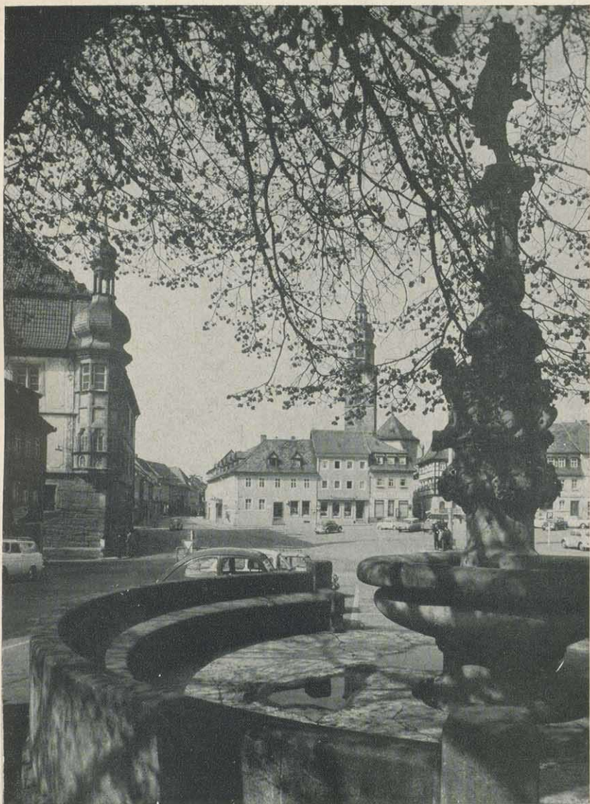
Königshofen im Grabfeld, Marktplatz mit Rathaus und Stadtkirche

Groß war die Freude in der Stadt, als nach einer Entschliebung des Bayr. Staatsministeriums des Innern vom 8. 9. 1958 die hiesige Mineralquelle als „öffentlich benutzte Heilquelle“ bezeichnet wurde. Seitdem haben die Bemühungen, Königshofen zur wirklichen Badestadt zu formen und den Namen „Bad-Königshofen“ zu erringen, stetig zugenommen. Wenn nicht alles trügt, darf man in wenigen Jahren hoffen, dieses Ziel erreicht zu haben. In guter Zusammenarbeit von Stadt- und Landkreisverwaltung werden in Kürze die notwendigen Voraussetzungen geschaffen. Königshofen wird und will keine