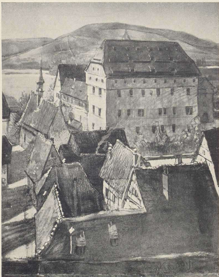
Pfalzgebäude: Nach einem Gemälde von F. Trost d. J. (Im Besitz der Familie Dr. Räbel)