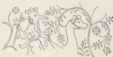
Kranichmensch (14. Jahrh.)

fen und die Trauungen vorzunehmen waren und welches Tuch die Ordensgeistlichen zu tragen hatten. Auch die Prozessionen entgingen nicht den Späheraugen der Polizei, die sie überflüssig fand, so kam es, daß auch die Sebastiani-Prozession in Forchheim trotz mehr als 150-jährigem Bestehen unterbleiben mußte. Sieben Jahre hat es gedauert, bis die Behörden einsahen, daß sie nicht staatsgefährlich sei und sie wieder erlaubten. (Geistl. Rat Stadtpfarrer Kümmelmann im „Königshof“, Febr. 1928, S. 15).