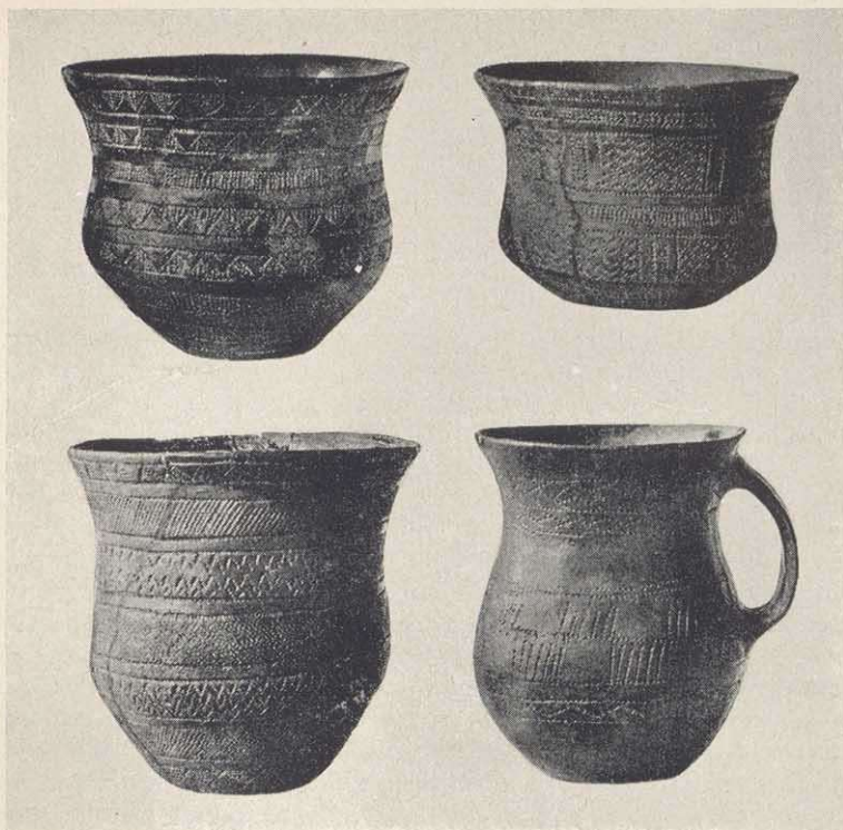
Glockenbecher (1/4 Größe)