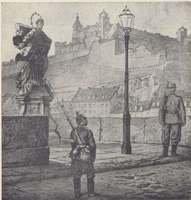
Preußischer und bayerischer Posten auf der „alten“ Mainbrücke in Würzburg während des Waffenstillstandes im August 1866

Der preußische Befehlshaber der Mainarmee erreichte die Bayern an der fränkischen Saale von Hammelburg bis Hausen bei Bad Kissingen . Nach kleinen Vorgefechten wurde der schmale Fluß überschritten. Bei Hammelburg verteidigten die Bayern stundenlang die links der Saale liegenden Höhen. Die Stadt brannte. Rechtzeitig zogen sich die Bayern gegen das Werntal zurück. Ihre geschickten Operationen verhinderten eine Niederlage, zumal sie nicht verfolgt wurden.