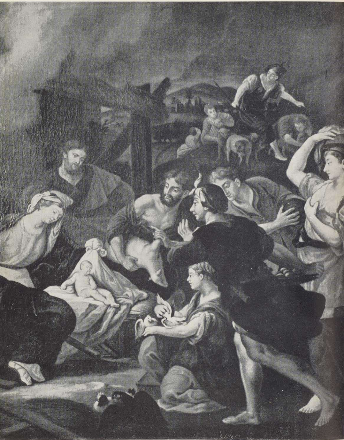
Christgeburt. Ölbild eines unbekannten fränkischen Meisters der Zeit um 1760. Schelfenhaus (Heimatmuseum) Volkach a. M.