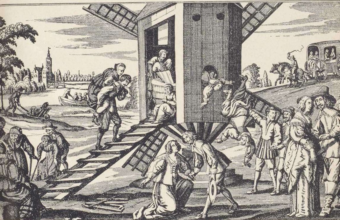
Windmühl, auf welcher Alte Weiber Jung gemahlen werden (Kupferstich um 1630)

In einer Beschreibung des Kölner Karnevals vom Jahre 1851 wird berichtet, daß die Darsteller mit der „Altweibermühle“ durch die Stadt zogen und das Wunder in jeder Straße wiederholten. Schließlich wurde sie in dem anhaltischen Dorfe Würflau bei dem „Mädchentanze“ an Pfingsten aufgestellt. Die Mädchen borgten sich dort von einem Bauern eine recht klapperige Dreschmaschine und brachten sie auf dem Festplatz in einem maiengeschmückten Zelt unter. Nach einem Umzug durch das Dorf traten die einzelnen Mädchen, scheinbar buckelig und lahm, der Reihe nach in das Zelt, während die Maschine ein lautes Klappern hören ließ; geheilt und verjüngt traten sie auf der andern Seite heraus. Auch in der Grafschaft Hohenstein (Niedersachsen) tritt die „Altweibermühle“ an Pfingsten in Tätigkeit 4) .