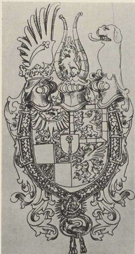
Wappen des Kurfürsten Albrecht Achilles