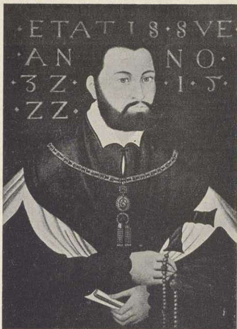
oben: Kurfürst Albrecht Achilles, Hochmeister und Gründer des Schwanenordens in Ansbach.

1484 stiftet Albrecht Achilles einen Jahrestag und einen Altar für die Ordensmitglieder der Georgskapelle von St. Gumbertus.