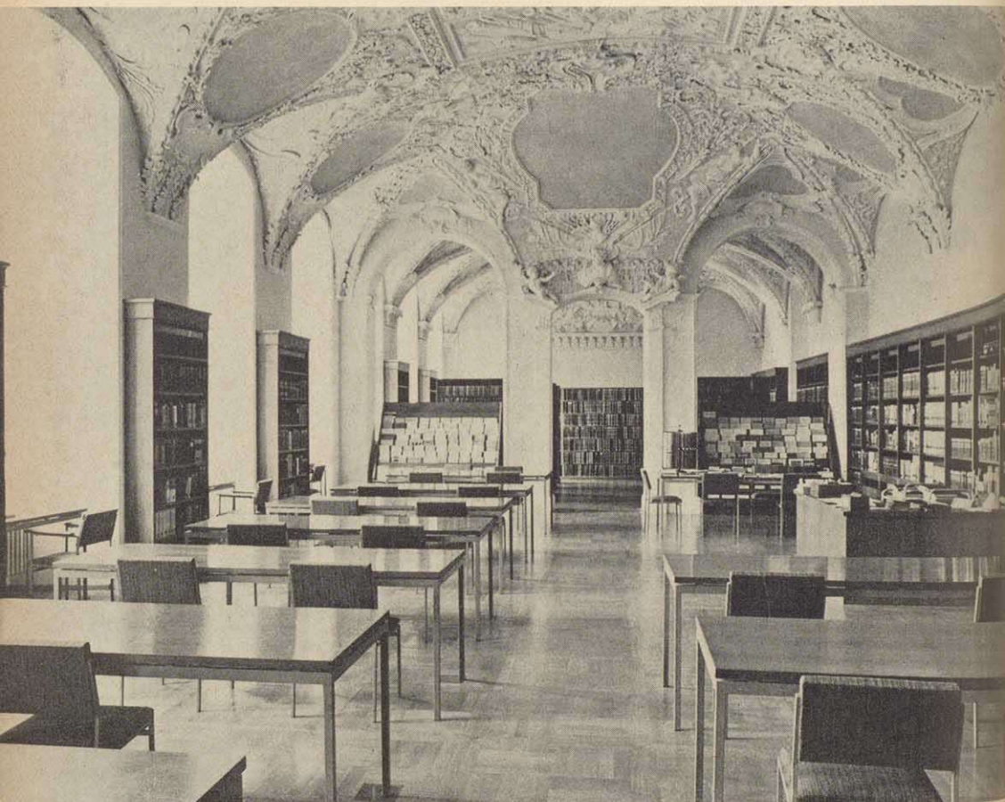
Blick in den Lesesaal. Ehemal. Gartensaal in der Neuen Residenz.

Ähnliches gilt auch für das Stadion-Zimmer des ehemaligen fürstbischöflichen Archivs, das zwar immer in der Residenz verblieben war, aber durch die Zeit manche Entstellung erfahren hatte und erst jetzt, gut instandgesetzt und mit alten Buchbeständen ausgestattet, wieder die hervorragende Kunstfertigkeit des 18. Jahrhunderts zeigt.