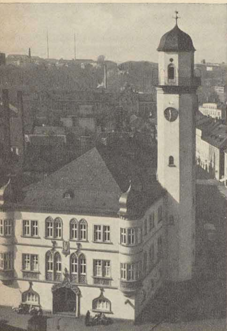
Das Hofers Rathaus in seiner heutigen Gestalt

haus und Michaelskirche auf dem Vogel- auplan von 1614/41