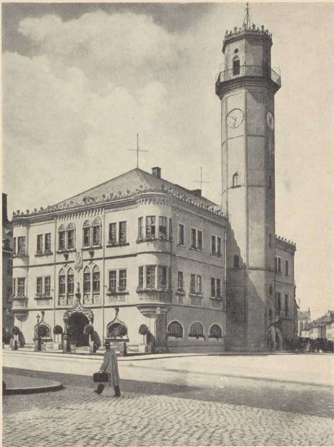
Neugotische Gestaltung mit Zackenkranz durch Georg Erhard Saher 1825/27

norddeutschen Backstein-Rathäusern gerichtet zu haben). Diese Form blieb bis 1950. Dann wurden die Zackenkränze wegen Schäden im Dachgebälk unter Beibehaltung der „neugotischen“ Dachneigung beseitigt, gleichzeitig dem Turm und den Erkern die runden Hauben aufgesetzt, welche s. Z. Baurat Baumann in der Zeit des Streites um die Bauform vorgeschlagen hatte. Wer suchen will, findet Sahers neugotisches Architekturornament vor allem an der Giebelseite.