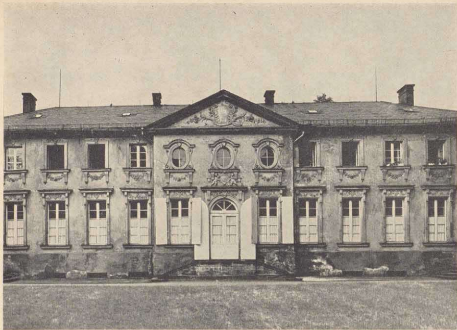
Der „Italienische Bau“ des Neuen Schlosses in Bayreuth ist der Sitz des Historischen Vereins für Oberfranken

Er geht allen Benutzern, die Donnerstag nachmittag mit ihren Bücherwünschen erscheinen, an die Hand. An drei Arbeitsplätzen ist es allen jenen, die unmittelbar bei den Büchern sitzen wollen, möglich, geruhsam und angeregt zu arbeiten. Eine Elektroheizung mit Nachtstrom sorgt im Winter für behagliche Wärme. Die etwa benötigten Karten, Ansichten, graphischen Blätter, Pläne und Porträt-Stiche sind in einer eigenen Sammlung zur Hand. Neben den Bücherregalen stehen die wohlgefüllten Stahlblech-Schränke mit Archivalen und Manuskript-Bänden. Dies alles ist durch einen gedruckten Crundkatalog mit zwei Nachträgen und, zusammengefaßt in einem alphabetischen Autorenkatalog, benutzbar, wenn auch noch einige Nachholbestände bereitstehen, die erst katalogisiert werden müssen, was vorwiegend für die seit vielen Jahrzehnten getreulich eingelieferten Tauschgaben benachbarter Vereine mit gleichen Bestrebungen gilt.