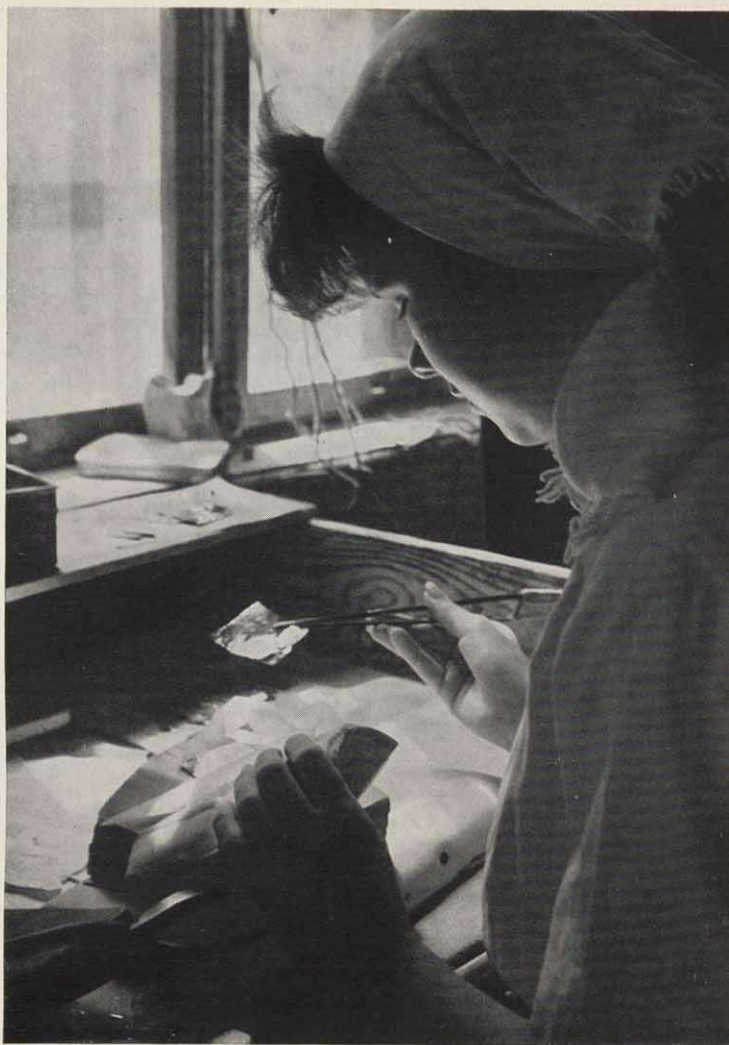
Die Zurichterin legt die Goldquadrate in die Form ein.