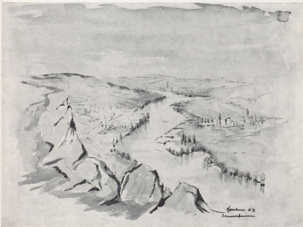
Sommerhausen und Winterhausen Aquarell