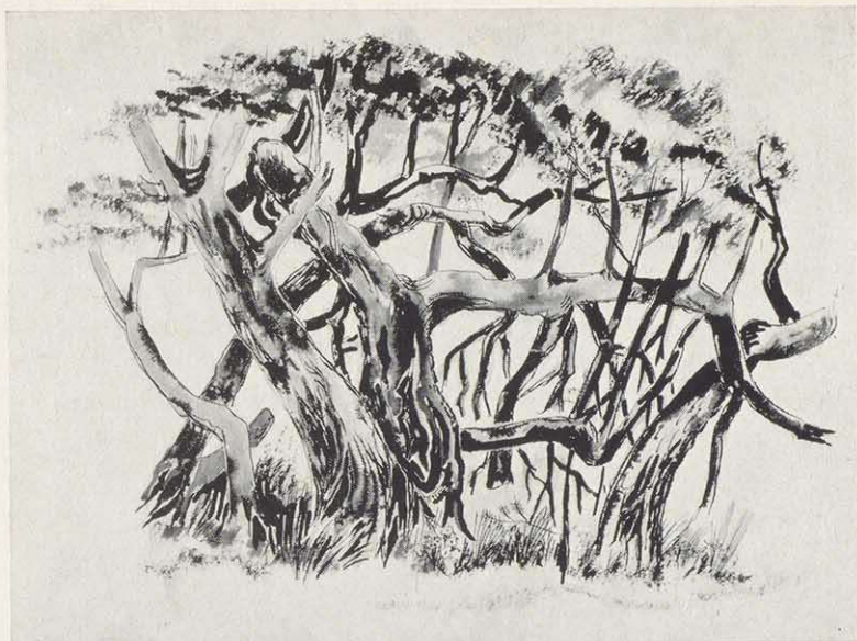
Baumgruppe b. Ochsenfurt Tuschzeichnung

sprach mit dem vitalen Fünfundsiebziger, dem man die siebeneinhalb Jahrzehnte nicht so ohne weiteres abnehmen will. Beglückend ist die reiche Schau seiner Bilder - vorwiegend Aquarelle -, die in Franken und auf ausgedehnten Fahrten in den Alpenländern, in Jugoslawien, Italien, Spanien und Frankreich entstanden sind. Die liebliche Mainlandschaft begeistert den Betrachter ebenso wie die lichte farbige Schönheit südlicher Regionen, wuchtiger Bergmassive, malerisch gruppierter Siedlungen, antiker Tempelruinen, idyllischer Fischerboote, bizarrer Baum- und Felsgebilde, Interieurs und die mit erstaunlichem Können aufs Papier gesetzten Wolkenstimmungen und Blumenstücke. Waren es früher „Schusters Rappen“, Fahrrad, Kanu und Skier, die den passionierten Wanderer und Sportler (er spielte aktiv bei Kickers Würzburg) mit Zelt, Schlafsack und Zeichenblock all die Motive aufspüren halfen, so ist es seit geraumer Zeit der selbstgesteuerte Wagen mit Wohnanhänger.