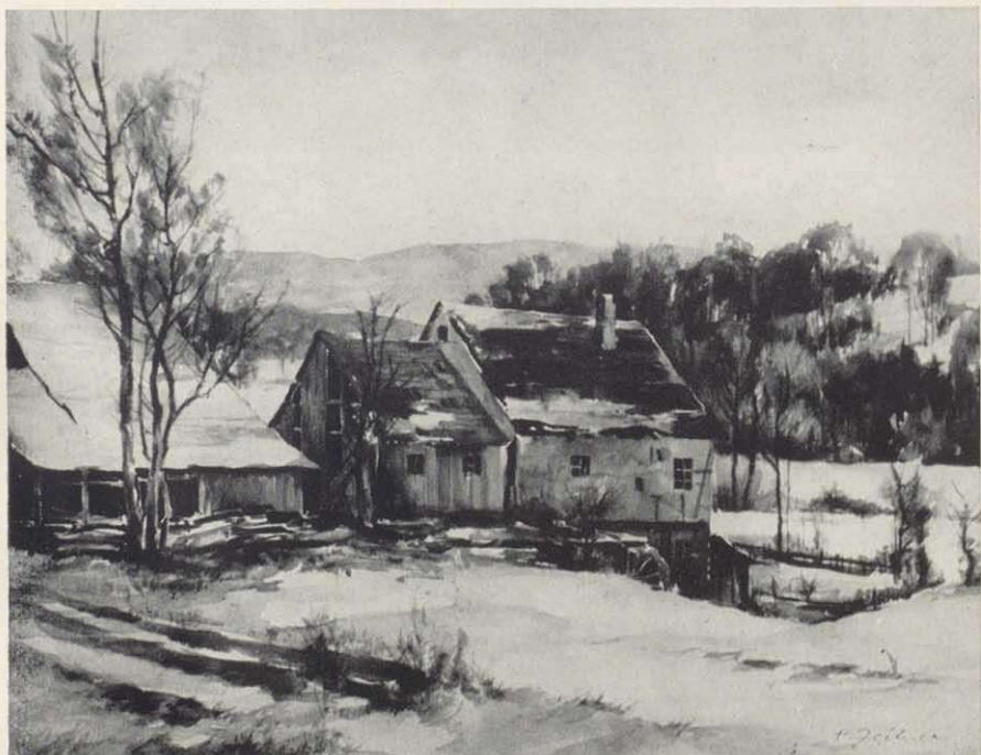
Mühle in der Rhön (Aquarell)