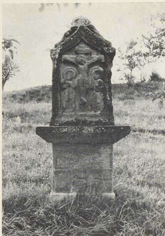
Die schöne Marter