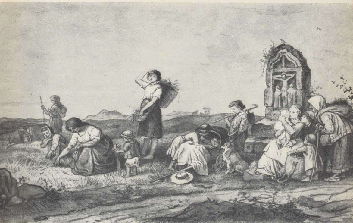
Ludwig Richters Aquarell „Die Ährenlese“

auf dem Stich „Lichtenfels“ mit Banz im Hintergrund ist sicher anzunehmen, daß eine heute noch dort zu findende Marter das Modell für die abgebildete abgeben mußte.