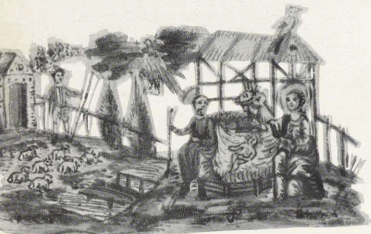
Pergamentschnittbildchen, einfache Miniaturenmalerei mit Text: „Christus ist ein Mensch gebohren. Von einer Jungfrau auserkohren“.