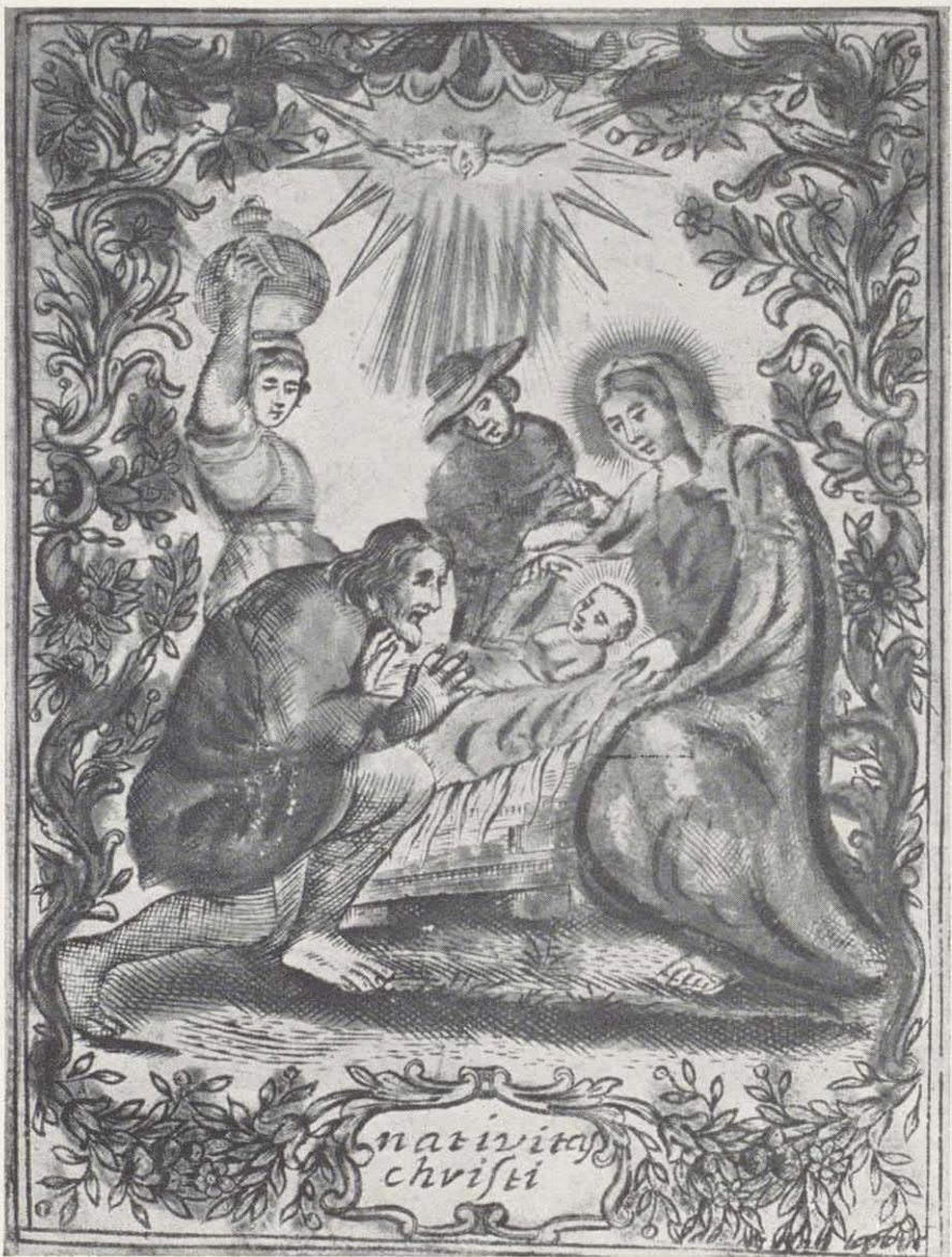
Kupferstich auf Pergament, koloriert, niederländisch

Empfang genommen hatte. All dies ergibt einen aufbaufähigen Grundstock für ein zu bildendes Diözesanmuseum, das trotz vieler Schwierigkeiten hoffentlich in nicht mehr allzu weiter Ferne liegt.