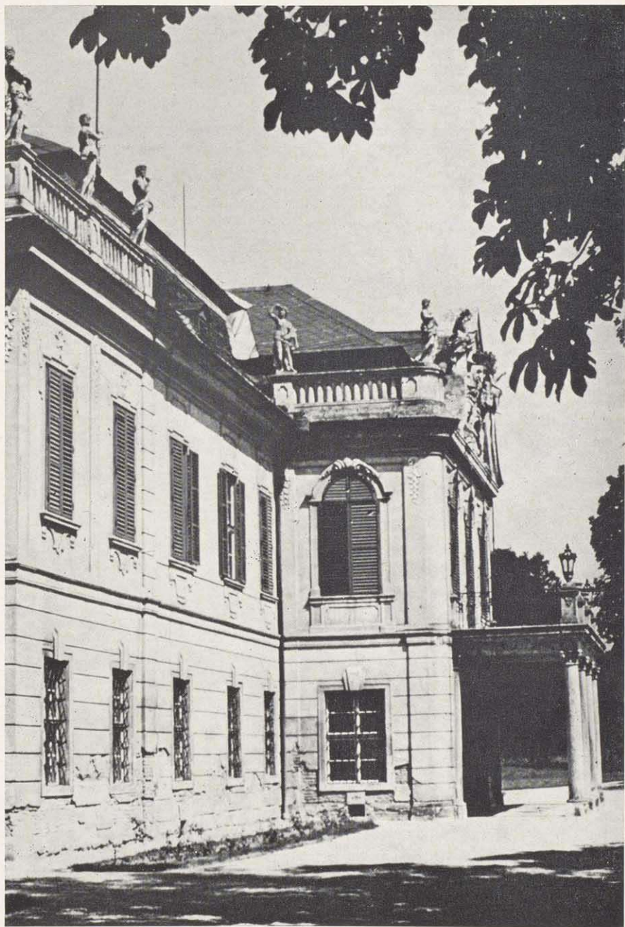
Der Mitteltrakt von Schloß Schönborn. Der österreichische Zweig der Familie Schönborn trägt den Namen Schönborn-Buchheim.