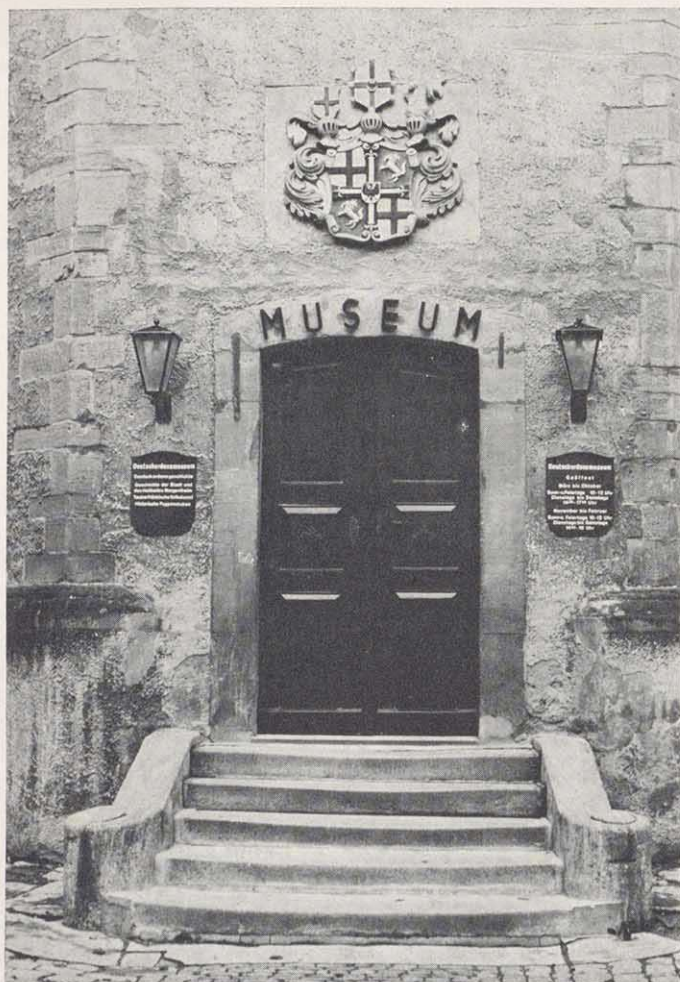
Eingang des Deutschordensmuseums mit Wappen des Hochmeisters Heinrich von Babenhausen (1572-90)