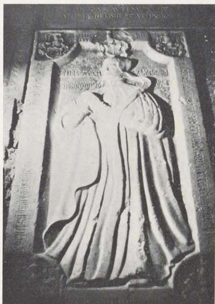
Grabplatte einer Frau Barbara des Pappenheimer Geschlechts 1576

In den 4 Ecken des Steines sind die Wappen von Leibelfingen, Crails- heim, Berlichingen und Leudershau- sen eingemeißelt.