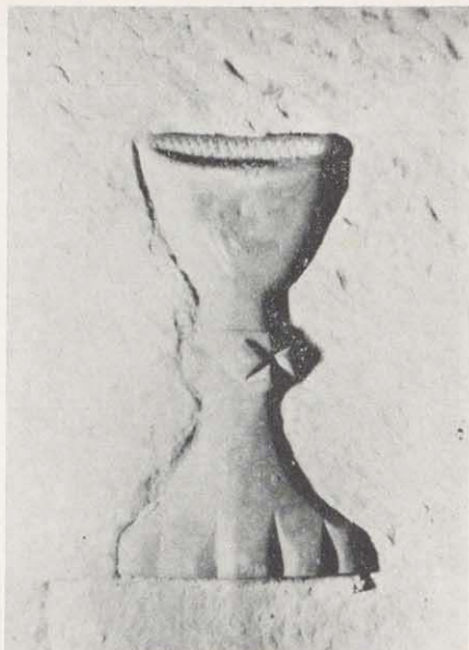
Bronzekelch in eine Grabplatte eingelassen (etwa um 1500!). Inschrift nicht mehr festzustellen, Grabplatte für einen Geistlichen