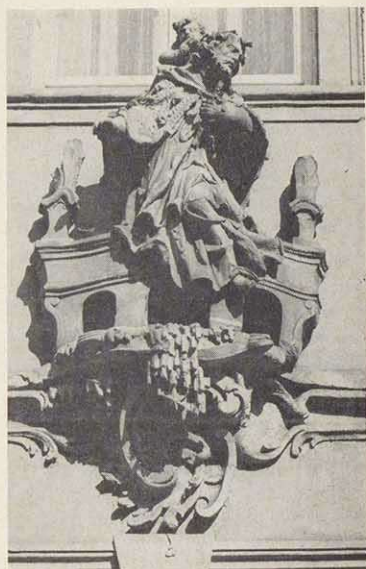
Sein Wohnhaus in der Frauenstraße zu Bamberg schmückte Joh. Bernhard Kamm mit der Figur St. Nepomuks.

Aus der Zeit zwischen 1765 und 1780 künden mehr als 50 Landkirchen mit größeren und kleineren Arbeiten von der Kammschen Meisterhand und Werkstatt. Schließlich betraute Fürstbischof Friedrich von Seinsheim Kamm mit der Fertigung eines Altars in seiner Privatkapelle, der zu höchster Zufriedenheit ausgefallen sein mußte, da knapp darauf – im Juli 1777 – die Ernennung zum Hofbildhauer erfolgte.