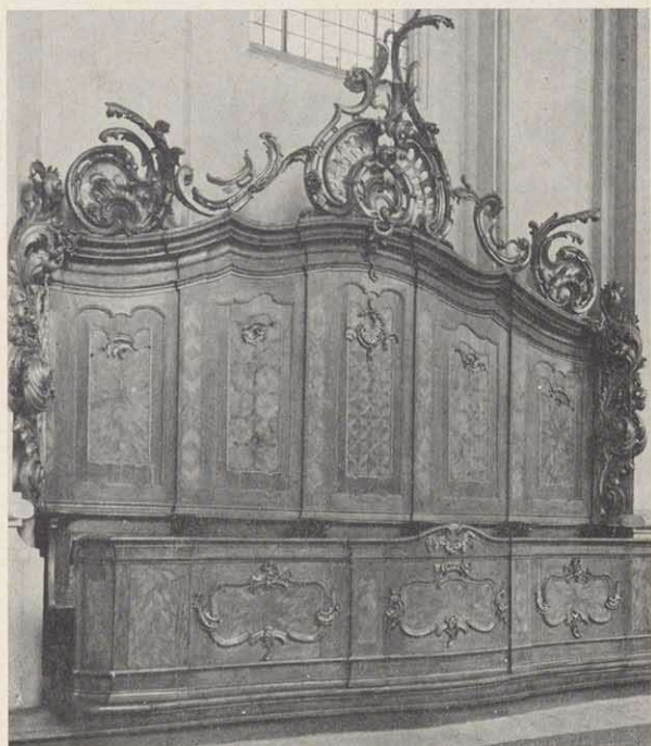
Kanzel von Joh. Bernhard Kamm in der Pfarrkirche seines Geburtsortes Obereuerheim bei Schweinfurt. Rechts: Chorgestühl mit Schnitzereien Kamms in St. Stephan, Bamberg (1769).