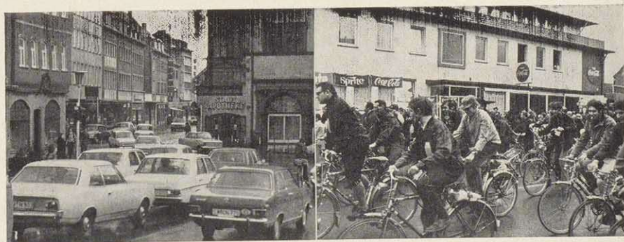
Radfahrer, Radfahrer – Autos, Autos; sie bedrängen sich bei Schichtwechsel gegen 16 Uhr.

Schweinfurt besitzt seit 1963 einen neuen Hafen. Eine weitere Verbesserung des Verkehrsanschlusses ist durch den Bau der Autobahn Fulda-Würzburg und der B 26 Süd, ferner durch die Elektrifizierung der Eisenbahnstrecke Würzburg-Bamberg erfolgt.