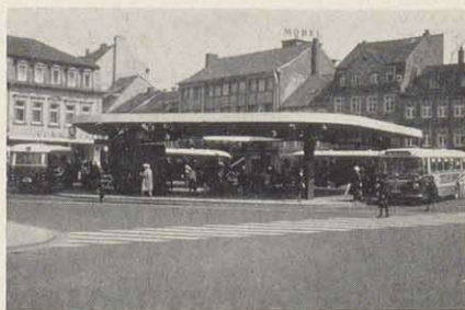
Omnibusbahnhof am Roßmarkt. Hier kreuzen sich alle Buslinien der Stadt.