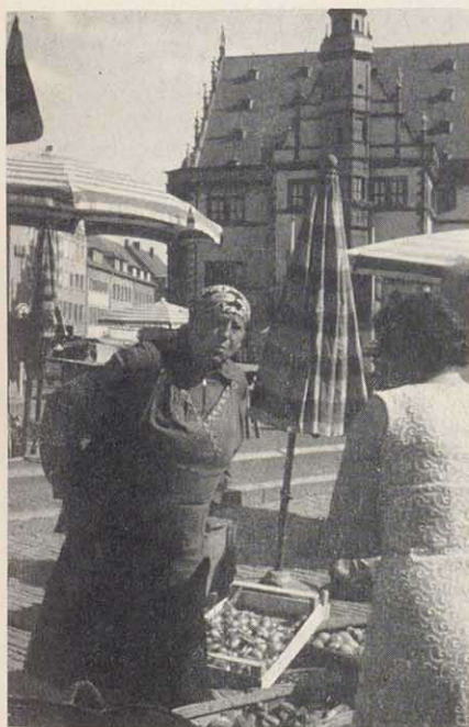
Nachmittags am Dienstag und Freitag, vormittags am Mittwoch und Samstag ist Wochenmarkt vor dem alten Rathaus (1570-72).

Neben etwa 100 Handwerksbetrieben, 13 Niederlassungen von Banken und Sparkassen haben zahlreiche Behörden, wie das Finanzamt, die AOK, das Ar-