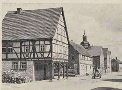
Rathaus in Grettstadt