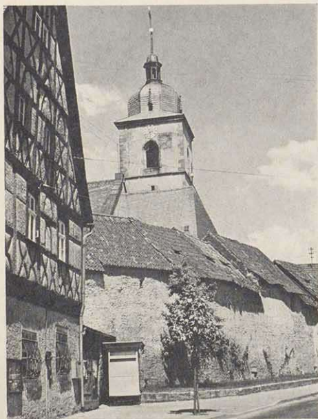
Rathaus mit Kirchgaden und ev. Pfarrkirche in Gochsheim

In Uchtelhausen , mitten in der „Schweinfurter Rhön“, wenige Kilometer nördlich der Stadt, steht das schöne Rathaus aus dem Jahre 1721 am Fuße des Kirchenhügels. Wie bei einem Torhaus führt der Kirchweg durch einen Durchgang im Erdgeschoß. Am oberen Stockwerk wurde bei der Renovierung des Jahres 1962 hübsch ornamentiertes Fachwerk freigelegt.