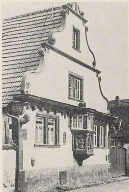
Das Apostelhaus in Gochsheim

Aus der möglichen Fülle privater Wohnbauten sei als Besonderheit das Apostelhaus in Gochsheim herausgegriffen. Kunstvoll ist die Schauseite der Straßenfront gestaltet: Ein Erker, der mit seinen frommen Steinreliefs Teil einer Kirchenkanzel gewesen sein könnte, springt zwischen den beiden kleinen