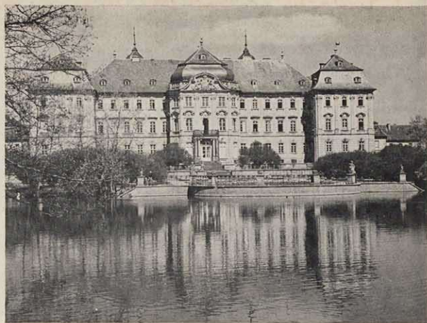
Schloß Werneck, Gartenseite

Das Schloß zu Werneck ist zweifellos das schönste und kunsthistorisch bedeutendste Bauwerk des Schweinfurter Umlandes. Nahe einer scharfen Biegung des Flößchens Wernn hebt es seine Türme und Mansardendächer aus sanft-welliger Landschaft, eine verkleinerte Ausgabe des „Schlosses über allen Schlössern“, der Würzburger Residenz. Gemeinsam ist beiden Schlössern als Baumeister der geniale Balthasar Neumann, gemeinsam auch der Bauherr: Fürstbischof Friedrich Carl aus dem kunstsinnigen Mäzenatengeschlecht Schönborn, in dessen Kopf – nach eigener Äußerung – der „Bauwurm“ sehr effektiv sein Wesen trieb. So amüsiert die Story der Entstehung des Schlosses Werneck noch heute: 1732 war erst von der Notwendigkeit einer „Absteige“ auf dem Wege nach Bad Kissingen und Bamberg die Rede, denn bei den damaligen Straßenverhältnissen waren beide Orte von Würzburg aus nicht in einem Tage erreichbar. Sodann wurde ein „Sommersitz“ mit Wirtschaftsgut und Fasanerie geplant, aber Bauherr wie Baumeister hatten immer neue Einfälle und Wünsche, so daß das Projekt schließlich in die heutigen Ausmaße hineinwuchs und bis zum Jahre 1744 mit einem Kostenaufwand von 368429 Gulden verwirklicht wurde. Arges widerfuhr auch diesem Schloß nach der Säkularisation: So wurde es 1855 Irrenhaus, und der erste Anstaltsdirektor Dr. Gudden ließ für das Pflegepersonal quer durch den Ehrenhof eine stilllose Wandelhalle bauen; erst vor wenigen Jahren wurde diese wieder entfernt.