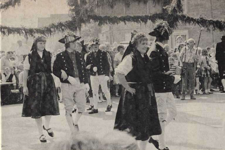
Aufzug der Trachtenpaare beim Sennfelder Plantanz