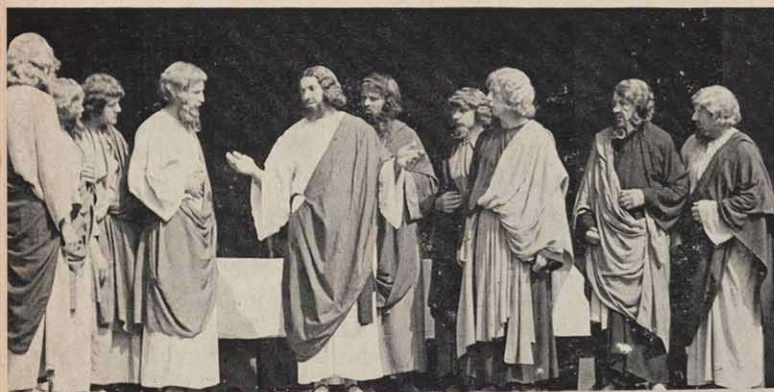
...ne aus den Passionsspielen zu Sömmersdorf