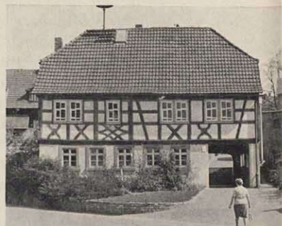
Rathaus in Uchtelhausen