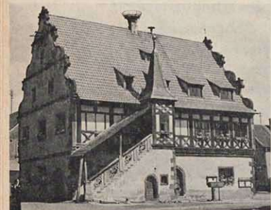
haus in Dürfeld

Das Schloß zu Werneck ist zweifellos das schönste und kunsthistorisch bedeutendste Bauwerk des Schweinfurter Umlandes. Nahe einer scharfen Biegung des Flößchens Wernn hebt es seine Türme und Mansardendächer aus sanft-welliger Landschaft, eine verkleinerte Ausgabe des „Schlosses über allen Schlössern“, der Würzburger Residenz. Gemeinsam ist beiden Schlössern als Baumeister der geniale Balthasar Neumann, gemeinsam auch der Bauherr: Fürstbischof Friedrich Carl aus dem kunstsinnigen Mäzenatengeschlecht Schönborn, in dessen Kopf – nach eigener Äußerung – der „Bauwurm“ sehr effektiv sein Wesen trieb. So amüsiert die Story der Entstehung des Schlosses Werneck noch heute: 1732 war erst von der Notwendigkeit einer „Absteige“ auf dem Wege nach Bad Kissingen und Bamberg die Rede, denn bei den damaligen Straßenverhältnissen waren beide Orte von Würzburg aus nicht in einem Tage erreichbar. Sodann wurde ein „Sommersitz“ mit Wirtschaftsgut und Fasanerie geplant, aber Bauherr wie Baumeister hatten immer neue Einfälle und Wünsche, so daß das Projekt schließlich in die heutigen Ausmaße hineinwuchs und bis zum Jahre 1744 mit einem Kostenaufwand von 368429 Gulden verwirklicht wurde. Arges widerfuhr auch diesem Schloß nach der Säkularisation: So wurde es 1855 Irrenhaus, und der erste Anstaltsdirektor Dr. Gudden ließ für das Pflegepersonal quer durch den Ehrenhof eine stilllose Wandelhalle bauen; erst vor wenigen Jahren wurde diese wieder entfernt.