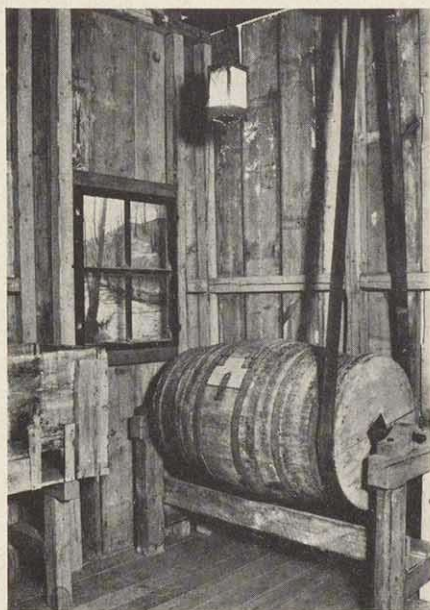
Die wiedererstandene Märlmühle im Natur-Museum Coburg: Das Polierfaß in der Fensterecke mit dem Ausblick auf die Lauter