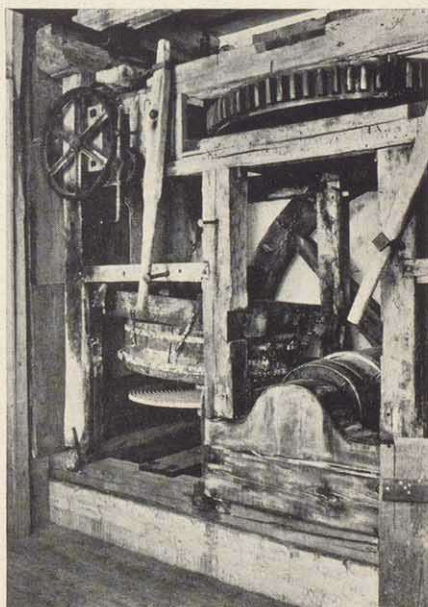
Die wiedererstandene Märlmühle im Natur-Museum Coburg: Ansicht auf einen der beiden Mahlgänge