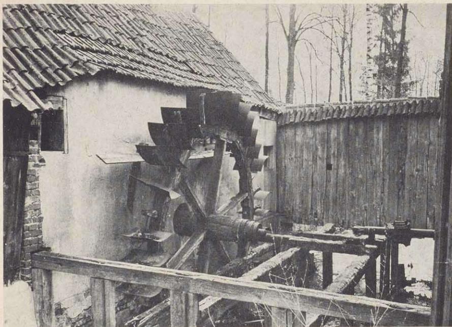
Die kümmerlichen Reste der letzten Märbelmühle in Oberlauter: das Wasserrad zum Antrieb der Mahlgänge. Inzwischen wurde das kleine Gebäude abgebrochen.