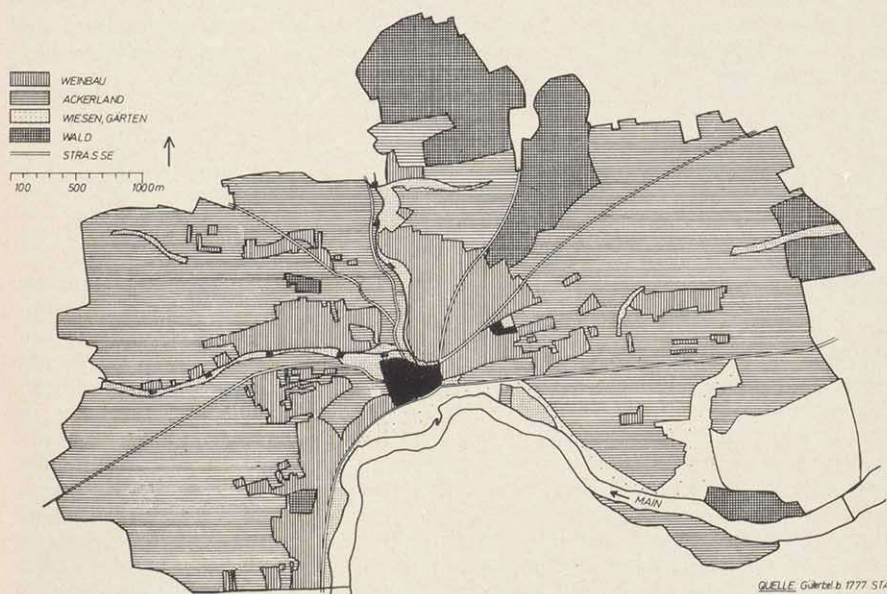
DETTELBACH: BODENNUTZUNG UM 1777