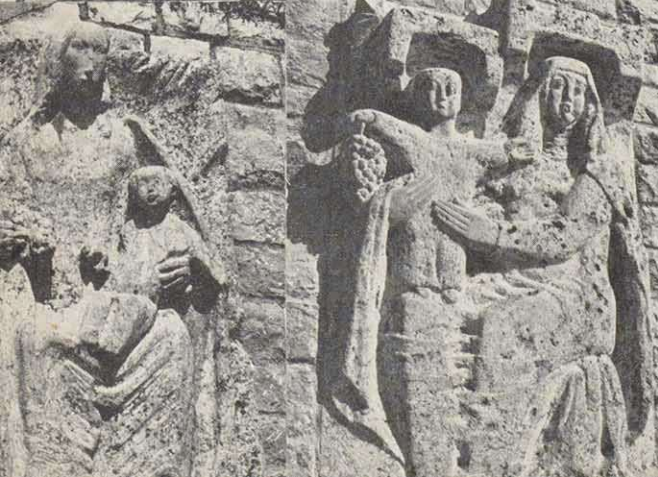
Aufstellungsort der Plastiken, Motiv, ausführende Künstler: Untereisenheim - „St. Urban“ von Willi Vath=Kirchheim; Som- merhausen - „Christus mit Wein- stock“ von Erwin Misch=Würz- burg; Volkach - „St. Kilian“ von Oskar Müller=Würzburg; Eibel- stadt - „Christus in der Kelter“ von Georg Schneider=Würz- burg (†); Escherndorf - „Trau- benmadonna“ von Otto Sonnleit- ner=Würzburg; Fahr - „Maria mit traubenhaltendem Jesukind“ von Helmuth Weber=Würzburg. Höhe der Bildwerke zumeist 2,50 bis 3 Meter.