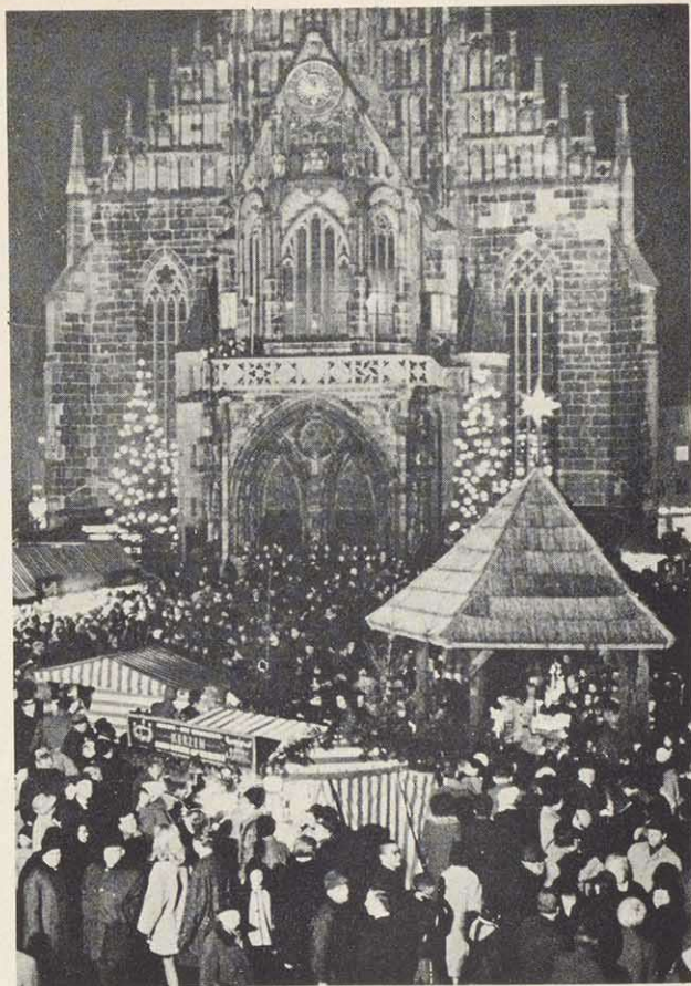
Kindlesmarkt 1967 mit Krippenbau in der Mitte

rücken und dort die fälligen Weihnachtskäufe zu tätigen. Im Lauf der Jahrhunderte wurde daraus ein Ritual: In langen feierlichen Reihen zog und zieht man bis heute durch die Königs- und Karolinenstraße, um sich sehen zu lassen und gesehen zu werden, um zu grüßen und wieder zu grüßen. Studentischer Hausgebrauch wurde so zum gesellschaftlichen Ereignis, das nicht zuletzt dem Christkindlesmarkt einen eigenen farbigen Akzent gegeben und sein Gesellschaftsgebahren belebt hat.