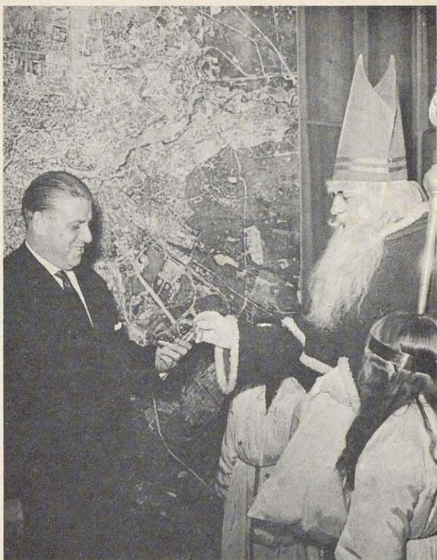
Humoriges Rendezvous zum Christkindlesmarkt 1963: Der „Nürnberger Nikolaus“ beschenkt den Oberbürgermeister