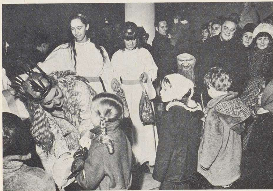
Christkindlesmarkt 1965: „Christkind“ und Knecht Rupprecht beschenken Kinder im Auftrag der Stadt

Weniger klar definierbar ist die Herkunft des „Zwetschgermännlas“, das seit Beginn des 19. Jahrhunderts auf den Nürnberger Weihnachtsmärkten auftaucht. Die Volkskunde weiß es brauchtumsgeschichtlich nicht einzuordnen. Seine Arme und Beine bestehen aus gedörrten Zwetschgen, die an Drähten aufgereiht sind, sein Leib aus Feigen. Angetan ist es mit bunten Stoffstreifen, die die Bauerntracht der Nürnberger Umgebung nachahmen. Doch gibt es dieses Produkt in nämlicher Herstellungsart in allen Gegenden Mittelfrankens, wenn auch unter anderem Namen.