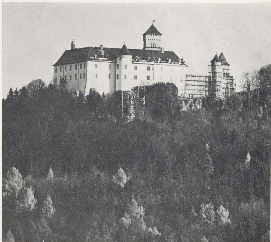
Burg Greifenstein, neueste Aufnahme nach dem Abbau des Gerüsts.

Atomkernstrahlen spüren Krankheitsherde auf / Alle wichtigen Organe sind darstellbar / Neue Geräte u. Radionuklide verbessern die Aussagekraft