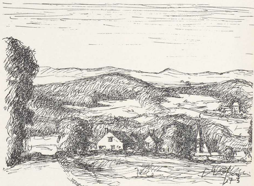
„Im Lohe“ bei Beerbach Federzeichnung: Stefan Breuling

Geographisch stellt das Neunhofer Land eine geschlossene Einheit dar. Den Landschaftscharakter bestimmt ein langgestreckter Höhenzug des Schwarzen Jura (Lias), der sich inselartig, als Vorposten der Juraformation, weit gegen das mittelfränkische Keuperbecken vorschiebt. Bei Kalchreuth (413m) beginnend, zieht er nach Osten und erreicht im Neunhofer Land bei Tauchersreuth 440 m Meereshöhe. In seinem weiteren Verlauf tritt er, stärker aufgegliedert und niedriger werdend, nicht mehr so markant hervor. Schließlich läuft er nach Südosten, zu den Tälern der Pegnitz und des Röttenbaches hin, aus, die ihn von der Fränkischen Alb trennen, an die er nur im Nordosten, bei Kirchröttenbach, näher herankommt. Im Norden ist der Zusammenhang durch das weiträumige Schwabachtal (Erlanger Schwabach), dessen Verlauf durch Absenkung in der Tertiärzeit vorgezeichnet wurde, deutlich unterbrochen. Die jüngeren Schichten des Braunen und Weißen Jura (Dogger und Malm) sind abgetragen. Es entstanden Landschaftsformen mit weichen Konturen, sanft gerundete Rücken und muldenartige Täler. Nur die höchste Erhebung des Kammes bei Kleingeschaidt und Tauchersreuth ist mit einer flachen Kuppe der untersten Doggerschicht überdeckt. In der Übergangszone Keuper-Lias tritt Rhätsandstein hervor, in den sich die von den Höhen herabströmenden Gewässer eingengt und romantische Schluchten ausgewaschen haben.