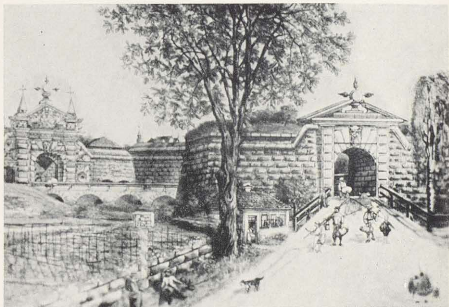
Das dritte und letzte Nürnberger Tor von 1698 mit Vorwerk nach einem Aquarell von Michael Kotz 1887. Erhalten blieb nur das Tor selbst (linke Bildseite) ohne Mauerfacen. Die Darstellung des Forchheimer Amateurmalers läßt eindrucksvoll die geradezu künstlerische Komposition der ehemaligen Festungsteile erkennen