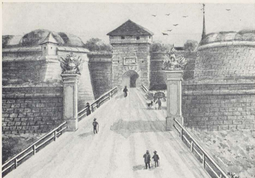
Zugang zum einstigen Bamberger Tor, 1557 errichtet, von Norden her. Es wurde 1881 abgebrochen