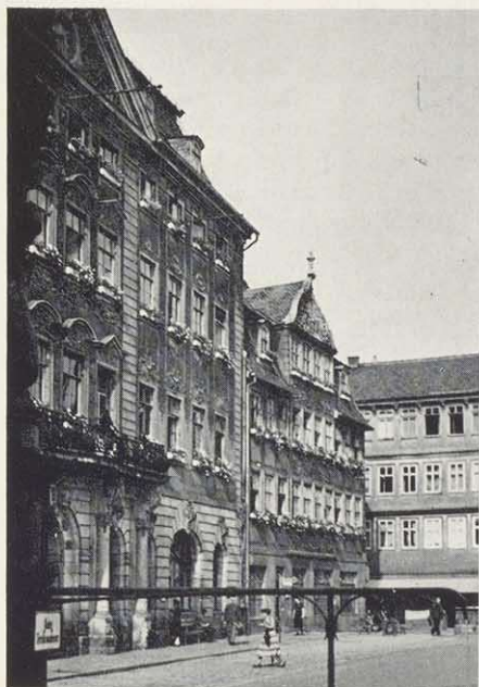
Rathaus mit Sparkasse und Marktbrunnen