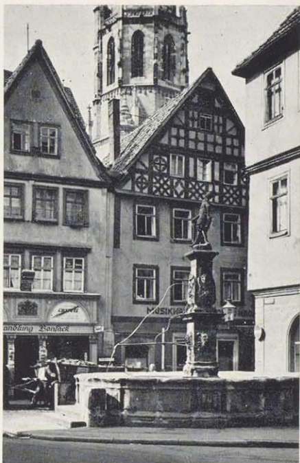
Rückertbrunnen mit Steingasse und Moritz-Kirche