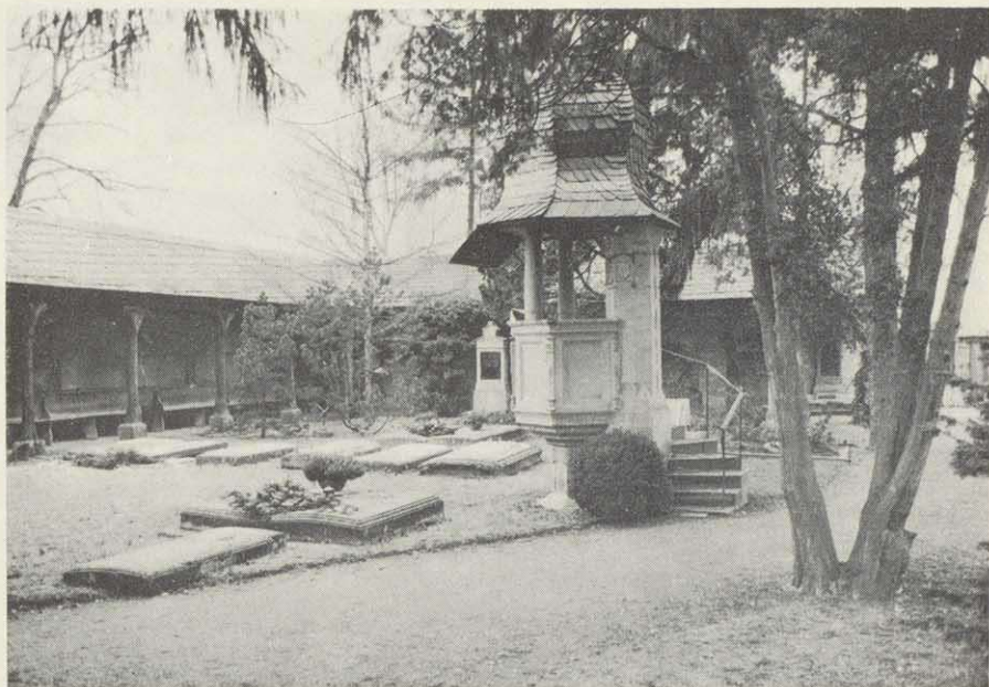
Bild 6 Friedhofskanzel in Mainbernheim

vergangener Zeit: die Arkaden und Kanzeln. Kanzel und Arkade gibt es noch in Abtswind, Mainbernheim, Marktsteft, Marktbreit, Prichsenstadt, Repperndorf und Wiesenbronn. Nur die Kanzel haben Buchbrunn und Sickershausen, in Segnitz und Kitzingen ist die Arkade übriggeblieben. Kanzel und Arkade vertreten die Stelle der Kirche, in der sonst der Begräbnisgottesdienst abgehalten wurde. Während die Gemeinde unter der langgestreckten Arkade Schutz suchte, stand der Pfarrer auf der durch einige Stufen erhöhten Kanzel.