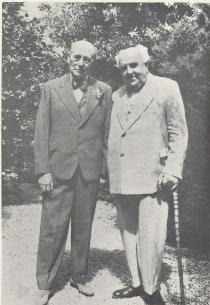
Bô Yin Râ und Felix Weingartner (links) im Jahre 1941

In einer Stringenz, die ihre Bestätigung in Form und Substanz aus sich selbst gebiert, wird der Mensch auf die ihm einzig begreifbare Wahrheit verwiesen als Ausgangsort allen seinen Erkenntnisstrebens: die Wahrheit deiner selbst. Wenn aber jeder einzelne die ihm faßbare