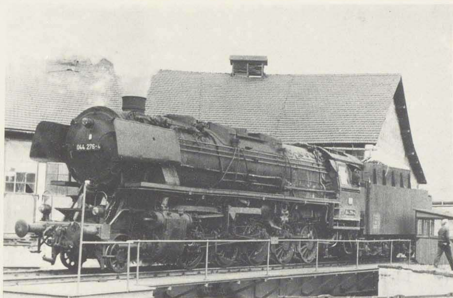
Abb. 3: 44 276 (044 276-4/DB) als Zuglok von 50 975 u. 52 5804 nach Ankunft des Lokzugs aus Weiden in DB-Original „Patina“.