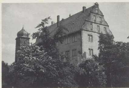
Vogtei, später Finanzamt, jetzt Postamt

Hausmachtpolitik und genoß seit seiner Stadterhebung gegen Ende des 13. Jahrhunderts besondere fürstbischöfliche Gunst. Die Fürstbischöfe nannten Gerolzhofen 'Unsere und Unsers Stiffts Stadt'. Aus dieser Zeit rührt die wirksam gebaute innere Stadtwehr, von welcher noch heute der runde Weiße Turm im Osten und der viereckige Eulenturm im Westen die Silhouette der Stadt eingrenzen. Urkunden sprechen von einem Schulmeister, welcher den Titel Rektor führen darf. Eine Reihe Märkte werden der Stadt verliehen (z. B. wird der Weinmarkt von Dingolshausen nach Gerolzhofen verlegt). Straßen- und Pflasterzoll darf erhoben werden. Gerolzhofen ist Sitz des gleichnamigen Archidiakonats mit 38 Pfarreien. Höhepunkt der Begünstigungen wurde 1391 die Errichtung einer Münzstätte in Gerolzhofen unter Münzmeister Dietrich von Heideberg.