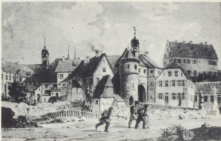
Ansicht mit dem abgebrochenen Spitaltor. Neben dem Tor das ehemalige Oberamtshaus, dann Landratsamt, jetzt Sitz der Verwaltungsgemeinschaft Gerolzhofen. Lithographie von Franz Leinecker, 1842

Amt Gerolzhofen von den Herren von Seinsheim um 10000 fl; 1490-1498 erfolgte die Erbauung der Scherenberg- und Bibratürme im Außenring der Stadt, des Bettelturnes und des Türmerturmes; 1497 die Erbauung der Johanniskapelle mit Beinhaus; 1520 die Anschaffung des Riemenschnideraltars für die Johanniskapelle.