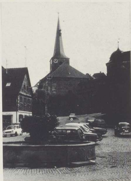
Thurnau, Lorenzkirche am Marktplatz; im Vordergrund der „Gabelmann“ = Neptunbrunnen (Werkstatt Elias Rantz, um 1700)

der geschlossenen Herrschaft, z. B. durch Zukauf die walpotischen Dörfer wie Azendorf und Welschenkahl im Jahre 1368 und noch vor 1395 Buchau. Ferner erlangten die Förtsche die Hochgerichtsbarkeit (1392). Es erforderte viel Geschick, die kleine Herrschaft Thurnau zwischen der Markgrafschaft Kulmbach-Brandenburg und dem Bistum Bamberg zu erhalten.