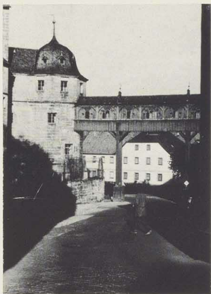
Verbindungsgang zwischen Schloß und Herrschaftsstuhl in der Kirche, erbaut 1800, neugotisches Schnitzwerk