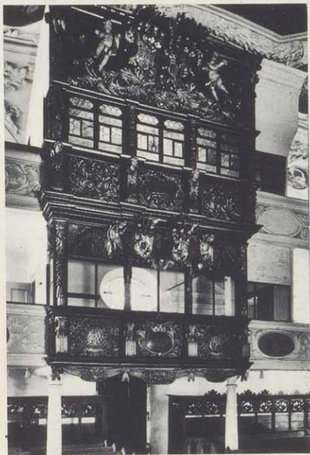
Herrenstand um 1706 von Elias Rantz, Doppelgeschoßig für die beiden Herrschaften in Thurnau