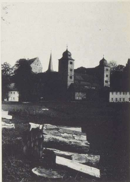
Thurnau, Blick auf das Obere Schloß mit Zehnturm und Weißem Turm (rechts), dazwischen Kutschenbau, links: Karl-Maximilian-Bau