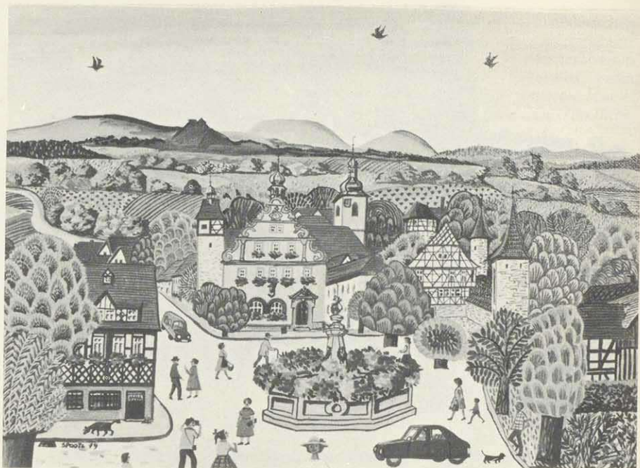
Spoetz: „Frankensommer in Rodach“ (Ölfarbe, Marie-Mathilde von Thüngen)

wurde die Therme charakterisiert: Calcium-Magnesium-Sulfat-Hydrogencarbonat-Therme von 33 bis 34° und einer Schüttung, die bei 2 bis 3 atü Kopfflußdruck 7 bis 8 l/s beträgt. Hinsichtlich der Kombination von Schüttung, Druck und Temperatur ist das Rodacher Wasser bislang in Nordbayern einmalig.