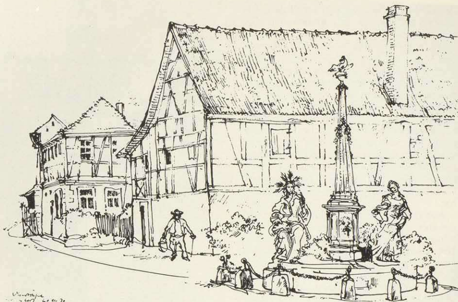
Neundorf b. Tambach, Tusche, 1978

eigentliche: Callot, Rembrandt, italienische und niederländische Zeichner des 17. Jahrhunderts. So gehört zu seinen Arbeiten neben der Disziplin gelegentlich auch eine übertreibende Schärfe — wie in den „Maskenmenschen“. Zeichnerisch verblüffen — nicht aber verletzen, das ist eines seiner Ziele.