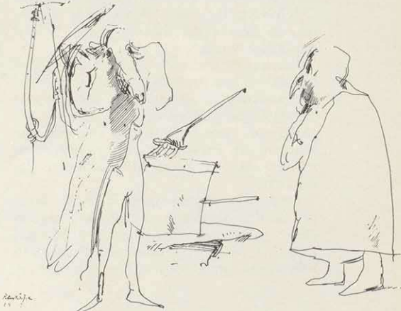
Maskenmenschen I, Tusche, 1979

und die Aneignung gelingt nur, wenn man sein Handwerk beherrscht. Auch kommt hinzu, daß er in Bildern denkt und nicht in Begriffen. Daß er sich an höchsten Vorbildern orientiert, ist selbstverständlich, denn nur der höchste Maßstab ist der