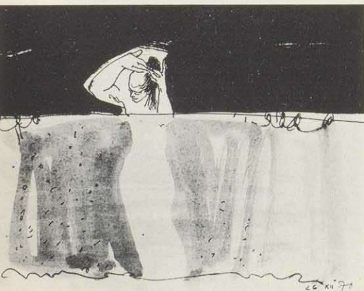
Morgentoilette, Tusche, 1978

Zeichnen begriffen als ein Überführen des Angeschauten in einen geistigen Besitz —