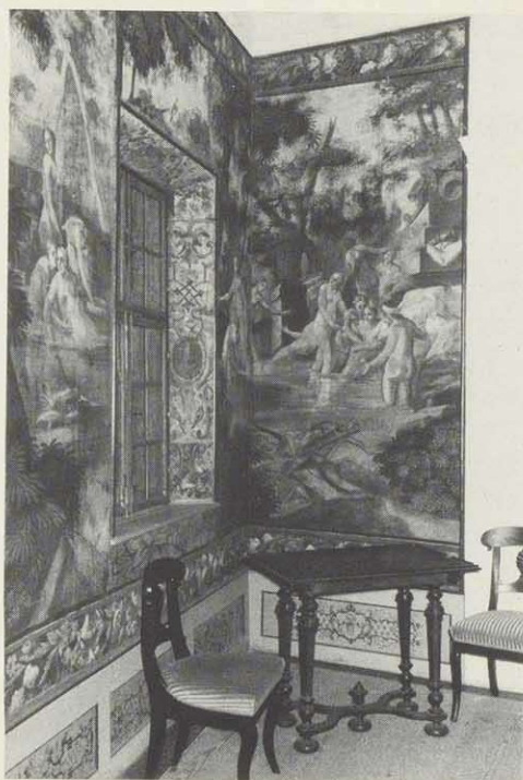
Wandbespannung mit mythologischen Darstellungen in der Götterstube des Hauptschlusses Neunhof