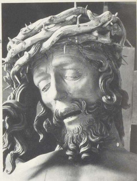
Wickel'sches Kruzifix 1520 in der Sebalduskirche von Veit Stoß. Foto: Eugen Kusch, Schwarzenbruck über Nürnberg 2

Unverwechselbar, wie die künstlerische Handschrift Riemenschneiders oder Grünewalds, ist diejenige von Veit Stoß; der Kruzifixus am Westchor der Sebalduskirche, eine freilich gute Durchschnittsarbeit aus gewiß nicht mittelalterlicher Zeitheimat, kann von der Natur des